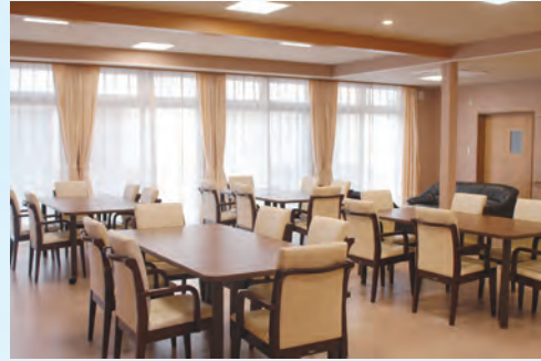
有料老人ホーム【居間兼食堂】