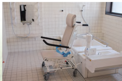
通所介護棟【特殊浴槽】