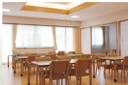
通所介護棟【居間兼食堂】