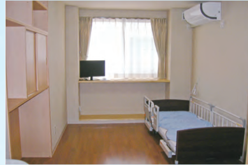
有料老人ホーム【居室】