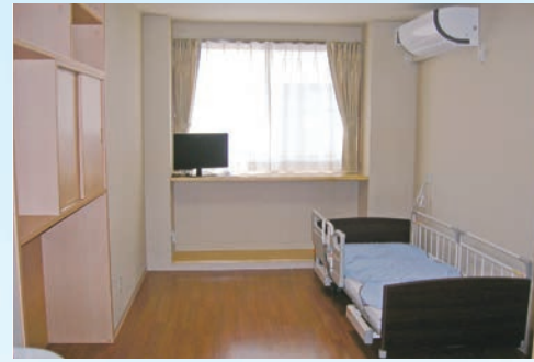
有料老人ホーム【居室】