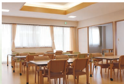
通所介護棟【居間兼食堂】