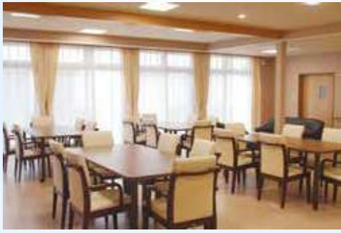
有料老人ホーム【居間兼食堂】