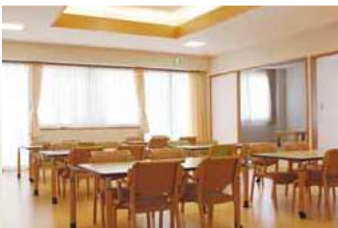
通所介護棟【居間兼食堂】