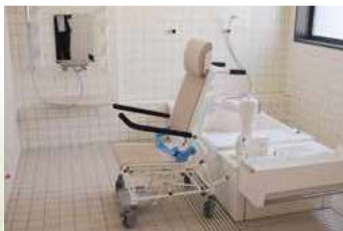
通所介護棟【特殊浴槽】