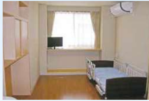
有料老人ホーム【居室】