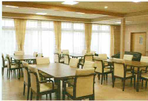
有料老人ホーム【居間兼食堂】