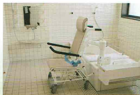
通所介護棟【特殊浴槽】