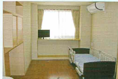
有料老人ホーム【居室】