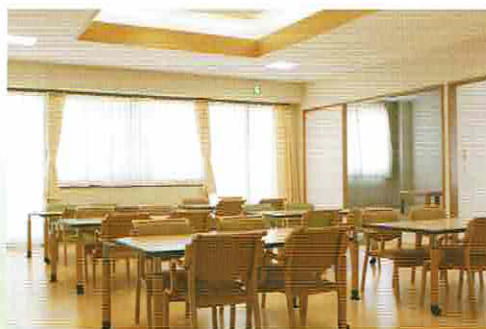
通所介護棟【居間兼食堂】